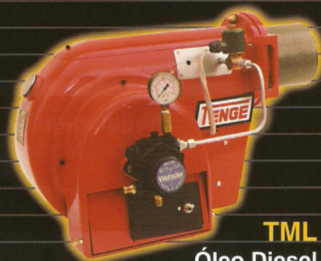
TML Óleo Diesel