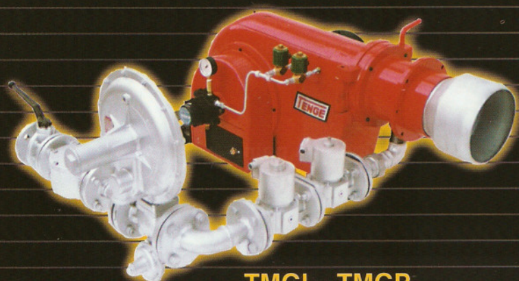
TMGL - TMGP Gás Natural / GLP DUAL: Gás - Diesel - BPF